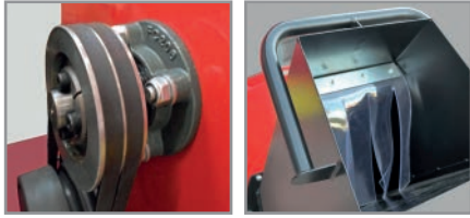
Cassone ribaltabile Collapsible box Faltbare box Caja plegable Boîte pliable