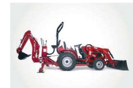
BY2000 • TX2000