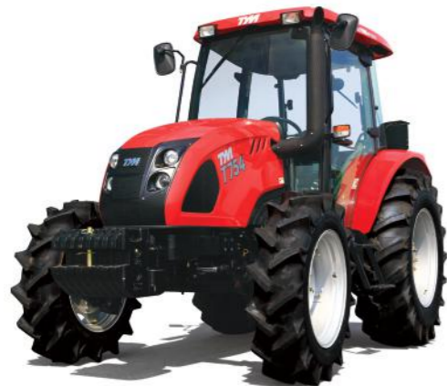
T654 • T754