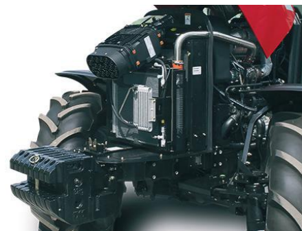
T854 • T1004 • T1104