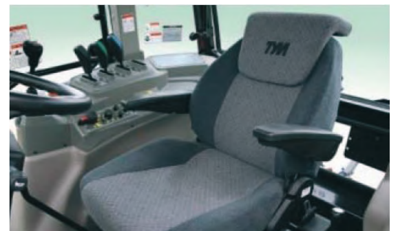
T1204 • T1304