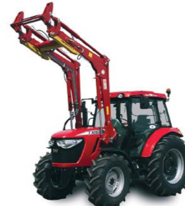
T854 • T1004 • T1104