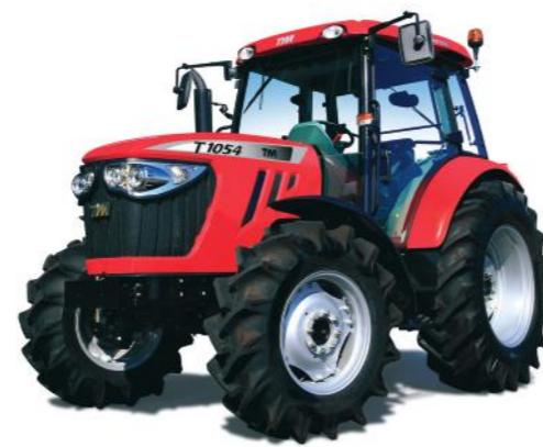
T854 • T1004 • T1104