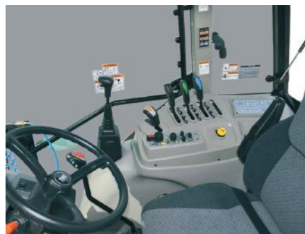
T854 • T1004 • T1104