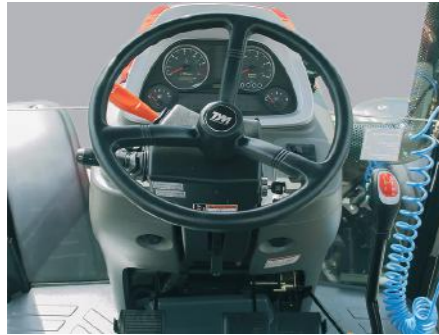
T854 • T1004 • T1104