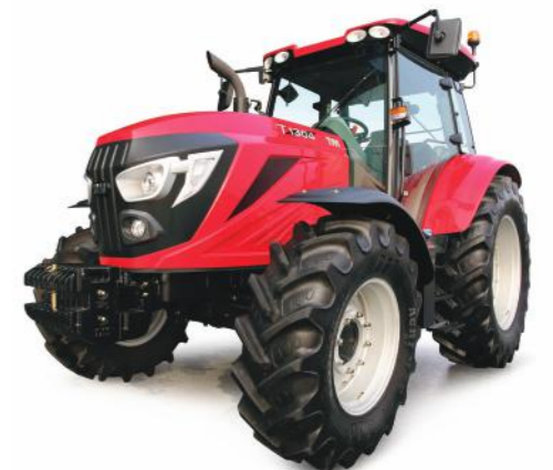
T1204 • T1304