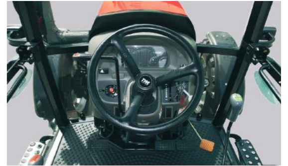
T654 • T754