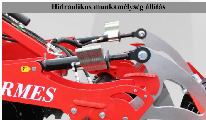
Hidraulikus munkamélység állítás

H-7522 Kaposújlak, 095/3 hrsz. Tel: +36-82/713-274, +36-30/336-9804 E-mail: bedenek@kapos-net.hu WEB: www.bedenek.hu