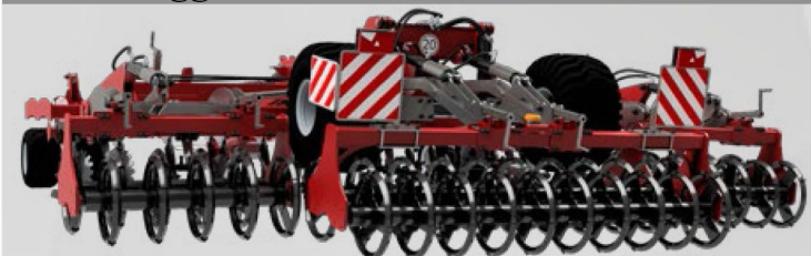
Független szintezőtárcsa beállítás