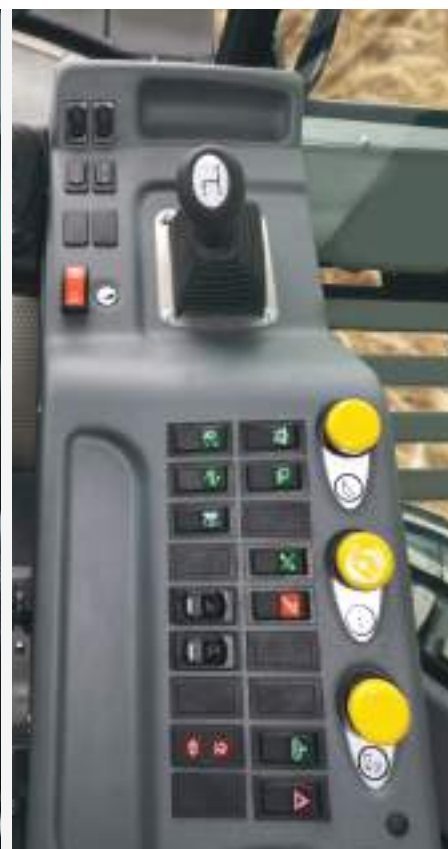
Fő vezérlő műszerfal

A Comfort fülkét úgy tervezték, hogy ideális és termelékeny munkakörnyezetet biztosítson a kezelő számára. Praktikus kényelmet és tökéletes komfortot biztosít, még a hosszú munkával töltött órák után is. Az Agritronic plus fedélzeti számítógépnek köszönhetően a kezelő egy helyben ülve teljesen az irányítása alatt tarthatja a kombájnt. A kezelőszerkezet ergonomikusan vannak elhelyezve, megkönnyítve és leegyszerűsítve a kombájn üzemeltetését. Az olyan elemek, mint a légrugós vezetőülés, az állítható fűtött tükrök és a kiváló szabad kilátás, az alapfelszereltség részét képezik.