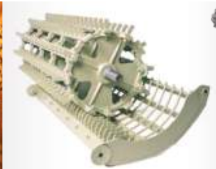
Opcionális rizs cséplődob és dobkosár