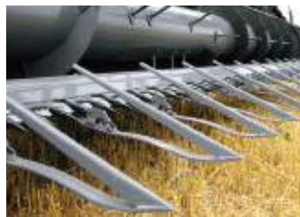
Freeflow asztal terményemelővel