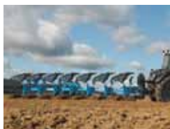
Hibrid váltvaforgató ekék