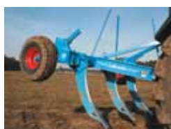
Előtét grubberek és mélylazítók