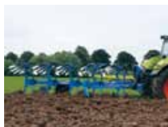
Függesztett váltvaforgató ekék