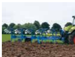
Függesztett váltvaforgató ekék