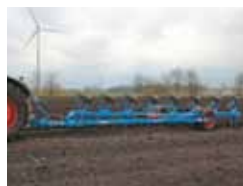
Féligfüggesztett váltvaforgató ekék